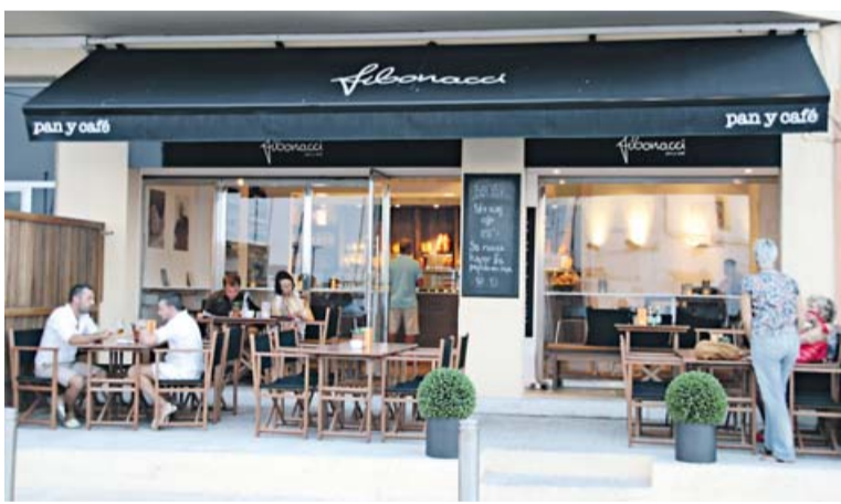
■ Modernes Café an der Hafenpromenade.

Unendlichen Erfolg und noch viele Filialen wünscht sich der Norweger John Kristiansen (39), analog zum namensgebenden italienischen Mathematiker Fibonacci, der eine berühmte unendliche Zahlenfolge erfand. Den Anfang machte 2009 ein Bäcker- und Gourmetprodukte-Shop in Ciutat Jardí, vor